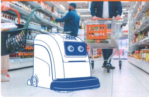
例えば、小売業 × 清掃ロボット