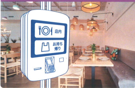
例えば、飲食サービス業 × 券売機